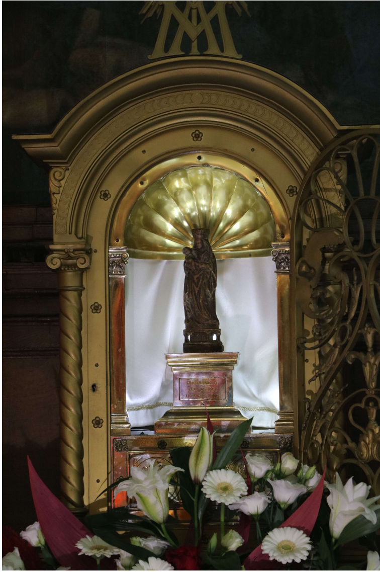
La Vierge originale