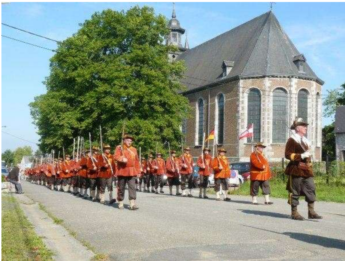
Compagnie de Fantassins – Soldats de Foy